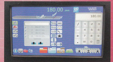
8"(12") 컬러 터치스크린 컴퓨터 제어 Hercules ® Computer Control